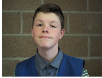
Félix Bernier Site Cégep